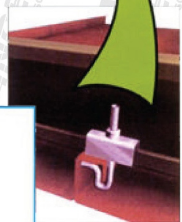
Clip de seguridad